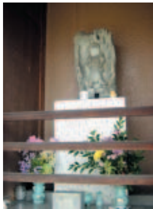
▲炎を背負っています

土山駅北側に木造の不動明王像があるのをご存じですか? 「野添のお不動さん」と呼ばれるこの像は、昭和7年に個人により作られ、8月24日にはお祭りをするなど、現在も親しまれています。