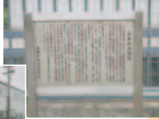
▲今は看板があるだけ

今回は町内にある、幕末の日本に関連する場所を紹介いたします。古宮の望海公園から少し北に歩いた場所に「砲台跡」の看板が立っています。