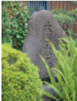
▲当時はダイタクと呼ばれていました

この石碑は大中にある善福寺というお寺の中に立っています。石碑には「明治五年創立 大澤小学校」の文字が刻まれています。この年が播磨町で最初に小学校が誕生した年であり、その小学校の名前を「大澤小学校」と言いました。