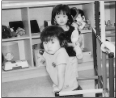
▲写っている方に写真または画像データを差しあげます。企画調整課まで。