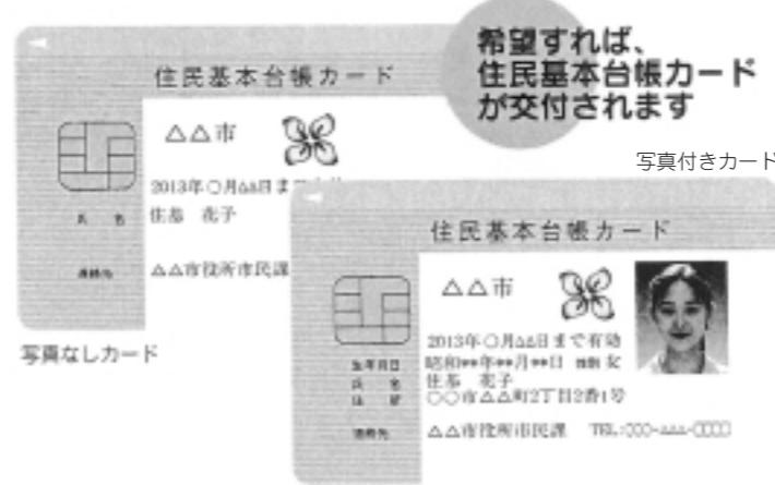
▲高度のセキュリティ機能を備えたICカードを採用

●住民基本台帳カードには「写真なし」と「写真付き」の2種類があり、写真付きを希望した場合は、公的な証明書として利用できます。