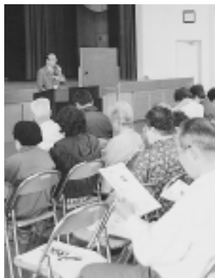
▲記念講演に聞き入る学生たち

4月16日(水)、中央公民館大ホールで「平成15年度播磨町ことぶき大学開講式」が開かれました。