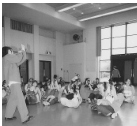
▲親子の笑い声が響きました

5月8日(木)、中央公民館大ホールで「親子ふれあい遊び」が行われ、2歳から4歳の子どもとその保護者約30組が参加しました。