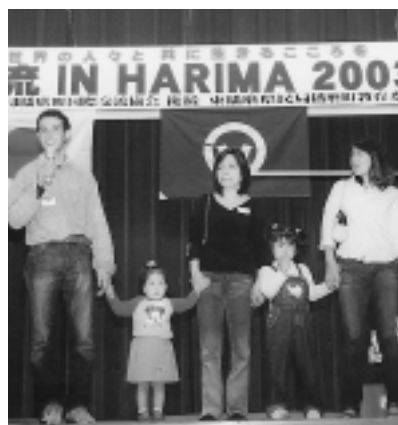
▲楽しいひとときを過ごしました

5月11日(日)、中央公民館で国際交流協会総会後、地域の国際交流パーティーが、プロジェクト21はりま、播磨南高校生など多くのボランティアの協力により開かれました。