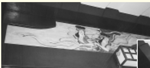
▲▼数々の繊細さに驚きです▶