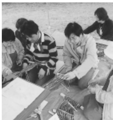
▲古代の織り物に挑戦!

5月10日(土)、11日(日)の2日間、中央公民館および大中国古代の村で大中遺跡メッセが開催され、教育関係者や市町文化財担当職員ら約100人が参加しました。