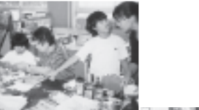
たくさん学びました

「捨てるものでも、こうして穴をあけてひもをつけるだけで音の出るおもちゃになるんだよ」「花に針金を通すときに、ちょっと工夫するとうまくまとめるよ」