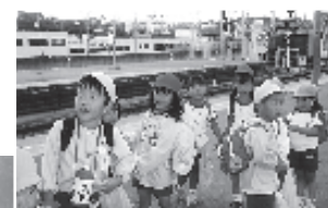
マナーよく電車に乗れました

十月二十二日。朝からすばらしい秋晴れです。今日は、遠足で明石公園へ出かけの日です。はじめてみんなで電車で乗って行くので、胸はワクワク。でも、ちょっと緊張もしています。