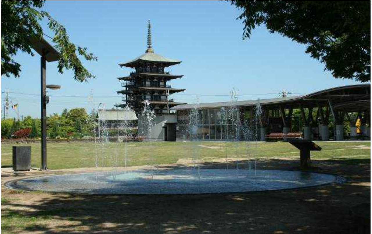
播磨町の景観写真（野添北公園）