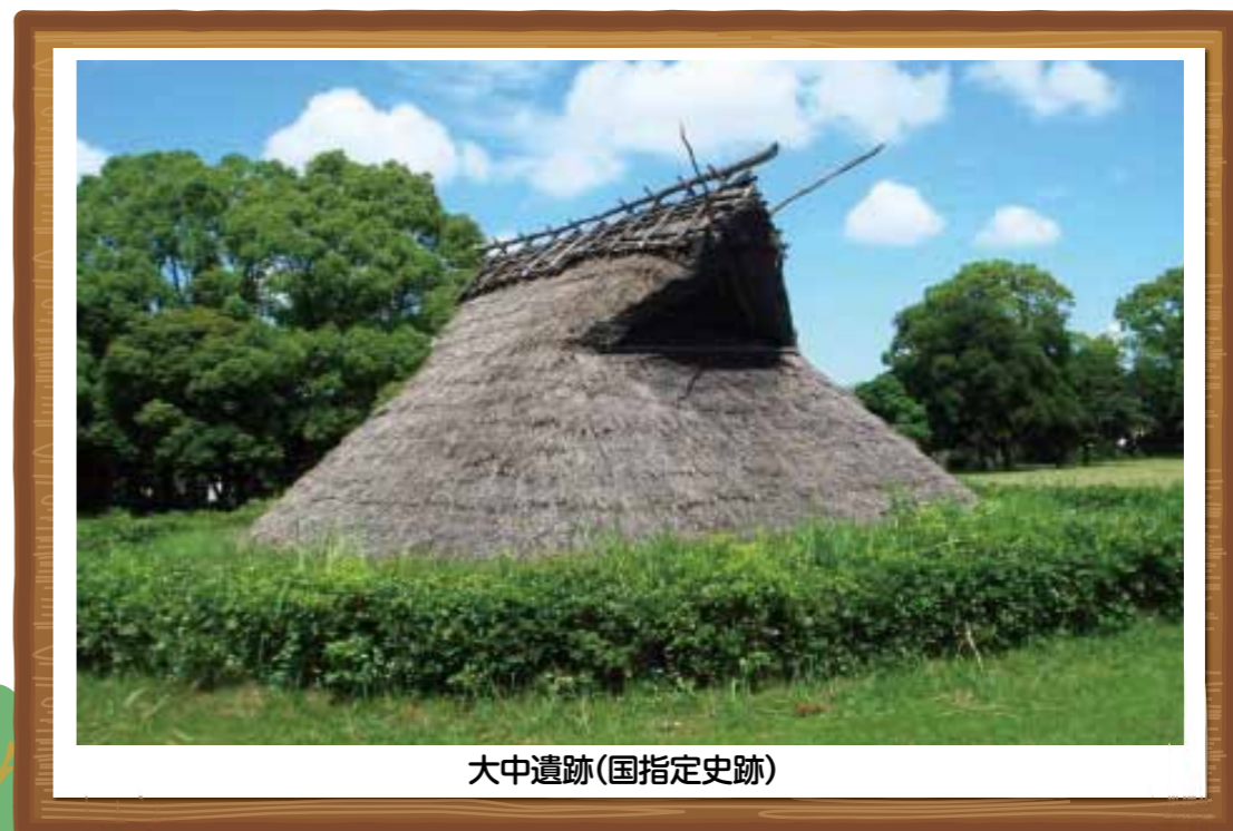
大中遺跡(国指定史跡)