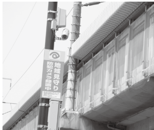
▲ごみステーションの防犯カメラ