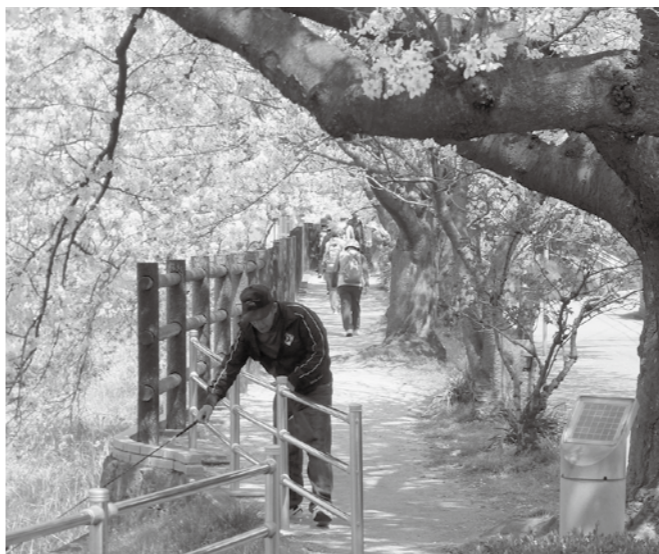
▲改修される喜瀬川左岸