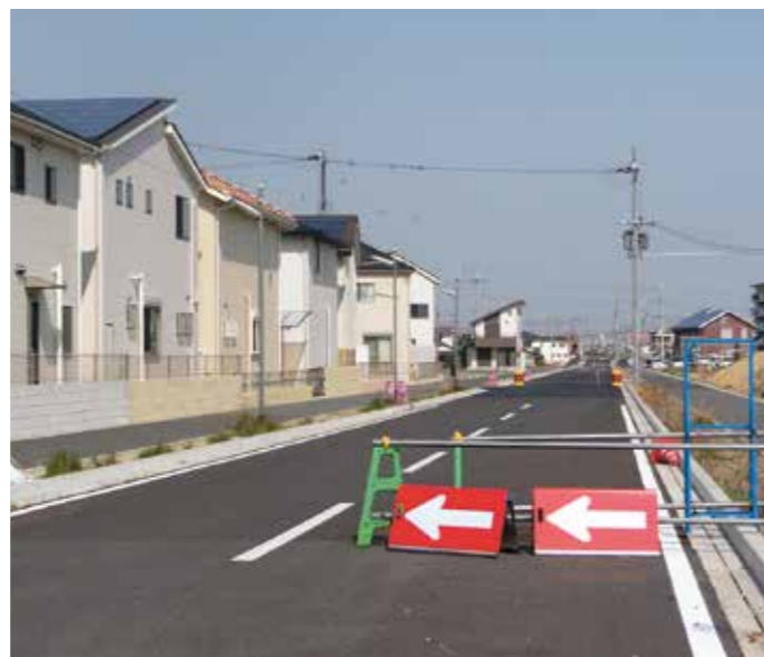
▲開通が待たれる町道浜幹線(古宮地内)

民生費は歳出総額の3分の1を占め、福祉給付金など新規事業や継続事業に33億736万円を計上しました。 総務費は、新たに地域公共交通環境調査検討業務やJR土山駅南での公有財産購入、コンビニ収納導入準備、自治会LED街灯設置補助などを計上しました。 土木費は、年度内の開通に向けて町道浜幹線道路の新設に1億9063万円、水田川環境整備や古宮橋の補修などを計上しました。 教育費は、一部の小・中学校の校舎や蓮池幼稚園の園舎、総合体育館の改修、また町民プール跡地整備設計などが盛り込まれています。 借入金返済のための公債費は前年度より1.0%減です。