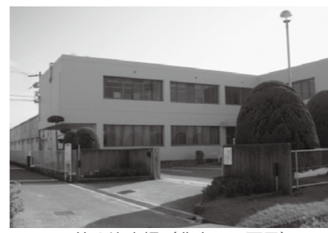
▲第3浄水場（北古田1丁目）

問 国立社会保障・人口問題研究所（社人研）と播磨町人口ビジョンのデータ、どちらの数値を基に改定を進めるのか。 答 人口ビジョンは政策効果が加味されているため、社人研に近い数値で設定したい。