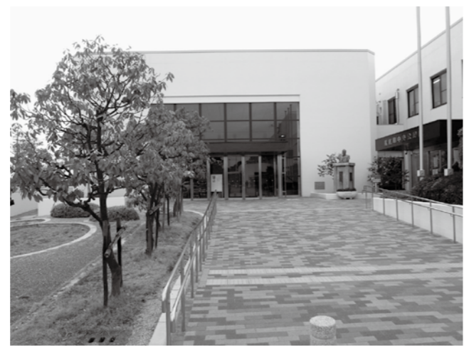
▲多くの人が利用する中央公民館

当面は現在の施設数を維持するが、用途変更や廃止なども検討し施設の維持管理の適正化を進める。