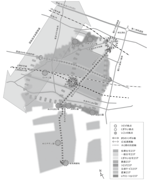
▲将来都市構造図

明姫幹線から北を北部、明姫幹線から二見尾上線までを中部、二見尾上線より南を南部と3地域に区分し、それぞれの特性と課題を示し、地域づくりの方針を定めている。協働のまちづくりをキーワードに、住民・事業者・行政が相互に連携しながら、まちづくりを進めていく計画である。