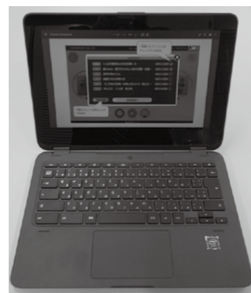
▲タブレットを使った学習が始まります

質疑 問 町立幼稚園の一時預かり保育時間が30分延長され、午後4時30分になるが、それ以降の時間延長の検討は。 答 午後4時30分以降の時間延長は保育体制的に難しい。