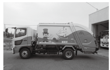
▲町内のごみ収集で活躍中

条例制定 名称は可燃ごみ中継センター 令和4年4月稼働予定のごみ中継施設について、名称を「播磨町可燃ごみ中継センター」とし、受入基準・受入検査を定めた条例制定を可決しました。 なお、高砂市の東播磨海広域クリーンセンターの試運転が11月に開始されるため、中継施設も稼働に向けて順次試運転を開始します。