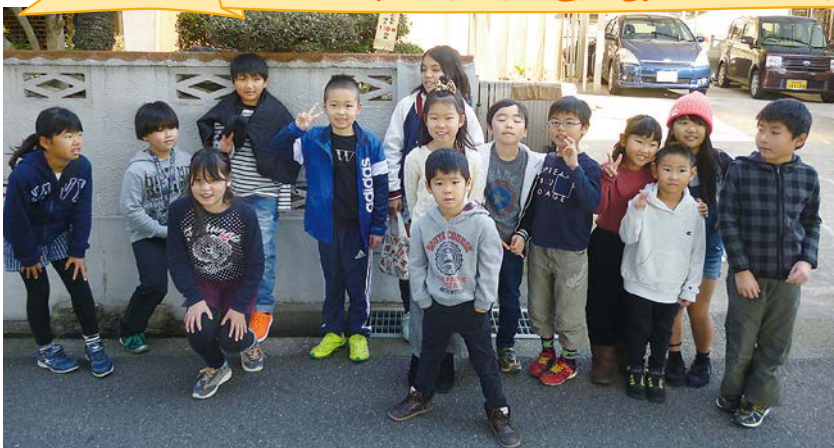
▲こども110番の家を知ってる？