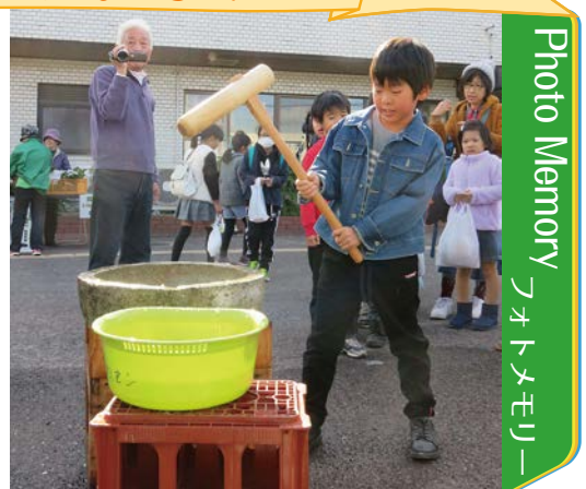
▲よいしょ！腰を入れて！