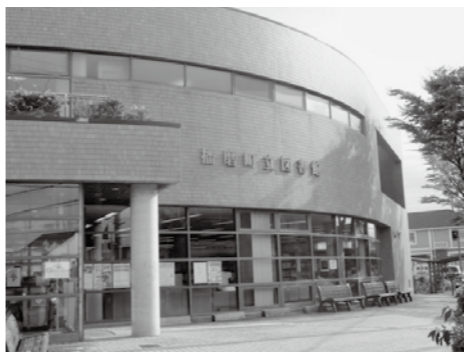
▲改修工事が予定される図書館

問 町の公共施設の多くは更新時期を迎えており、小中学校の教育施設や道路、橋は順次改修を実施しているが、他の公共施設の対策と現状は。