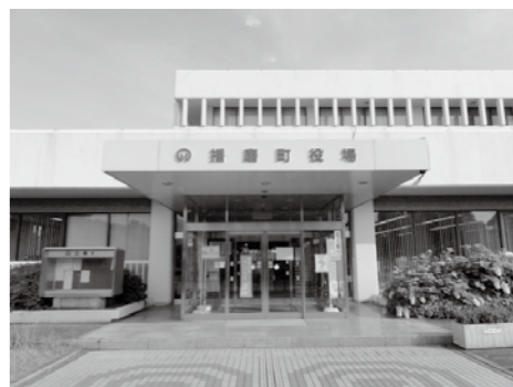
▲住民奉仕に寄与する人材育成の充実を

問 職員の政策形成能力を発揮させるためには、町長の人材育成への熱い思いと固い決意が必要不可欠であり、また職員のマインドにも火が点つていない限り真の自治体改革は実現できないと考える。