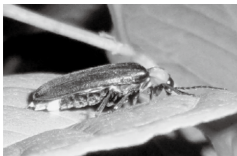
▲安らぎと感動をありがとう

問 住宅街にある野添北公園内のビオトープでホテルを観賞することができると好評です。ビオトープとは、生物の生息空間という意味であるが、人と環境の調和は町の魅力である。しかし、車いすやベビーカーでは、出入口に杭があるため、観賞することが難しい状況である。多くの方が観賞できるように整備すべきでは。