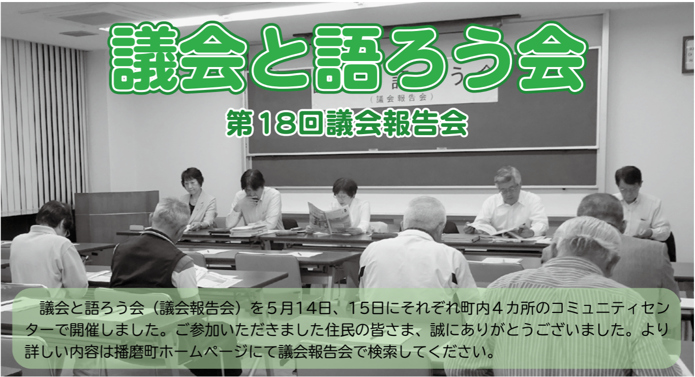
議会と語るう会（議会報告会）を5月14日、15日にそれぞれ町内4カ所のコミュニティセンターで開催しました。ご参加いただきました住民の皆さま、誠にありがとうございました。より詳しい内容は播磨町ホームページにて議会報告会で検索してください。