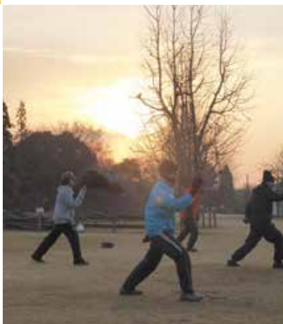
▲早朝太極拳を楽しむ皆さん（大中遺跡公園）