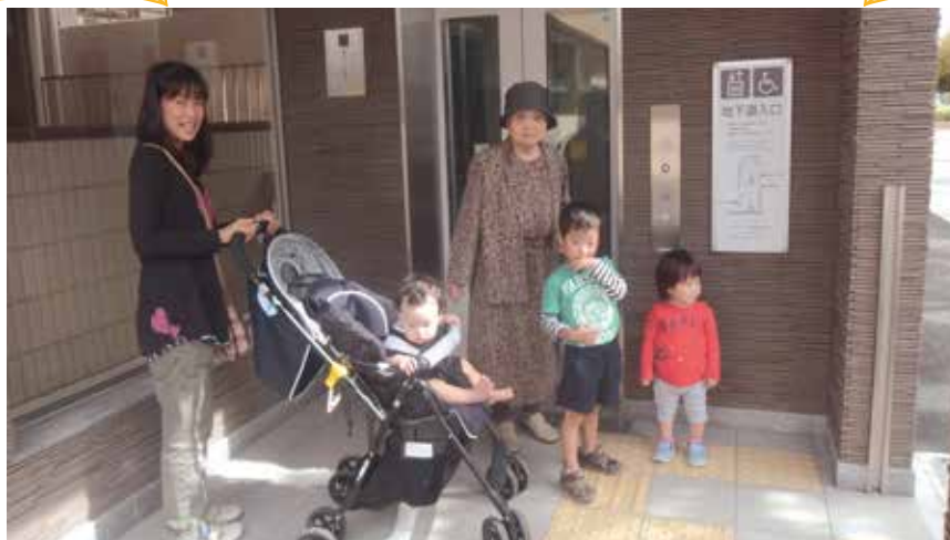
皆さんが待ちに待った播磨町駅エレベーター