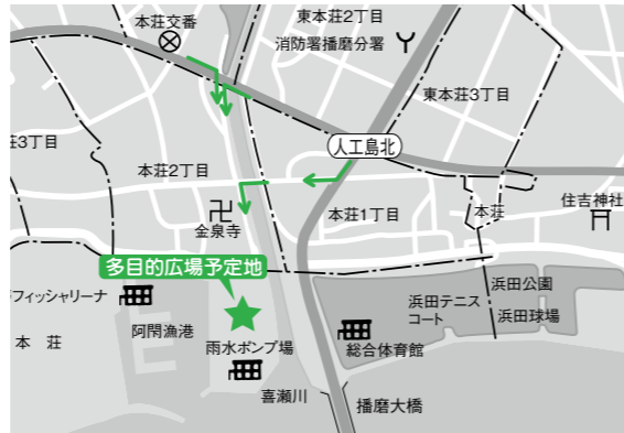
多目的広場予定地