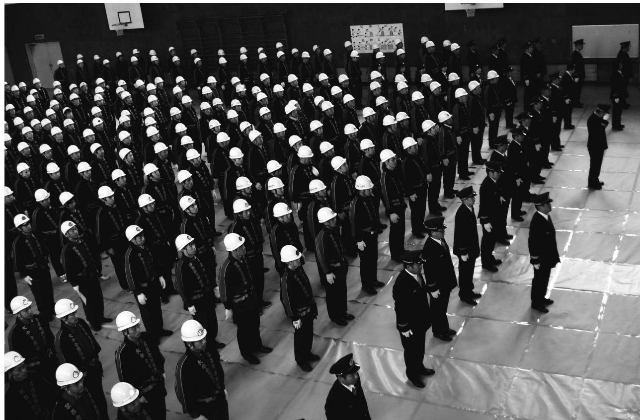
▲住民の大切な財産を守るためにがんばります「2008年出初式」(蓮池小学校)