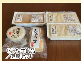
(有)松井食品 豆腐セット