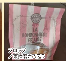
フロップ 東播磨カステラ