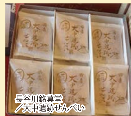
長谷川銘菓堂 大中遺跡せんべい