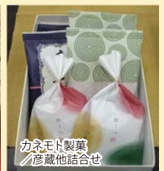
カネモト製菓 彦蔵他詰合せ