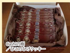
Gashiの樹 ひとのひげクッキー