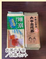
お茶の千宗 お茶セット