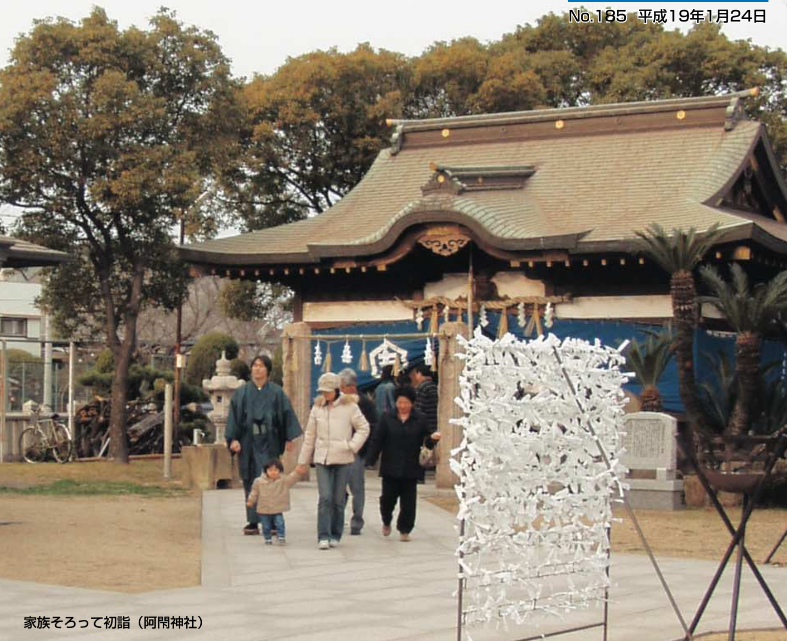
家族そろって初詣（阿閉神社）