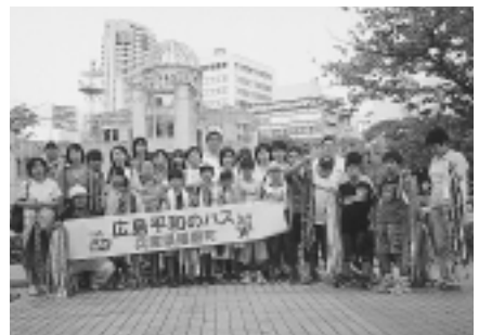
▲昨年参加されたみなさん

※申込者多数のときは、抽選により参加者を決定のうえ、7月25日(金)までに、申込者に連絡をします。