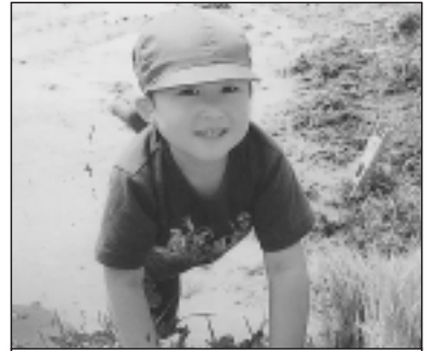
▲写っている方に写真または画像データを差しあげます。企画調整課まで。