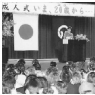
▲昨年の成人式の様子