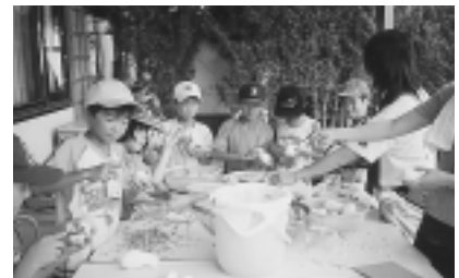
▲いろいろなことにチャレンジ!!

播磨町が交流をしている朝来町の子どもたちと一緒に、ゲームやキャンプファイヤー、飯ごう炊さん、そして水辺の観察など自然を体験し、翌日には朝来町の子どもたちと大中遺跡まつりに参加し、古代のロマンを感じてみませんか。きっと、この夏休みの素晴らしい思い出になるでしょう。