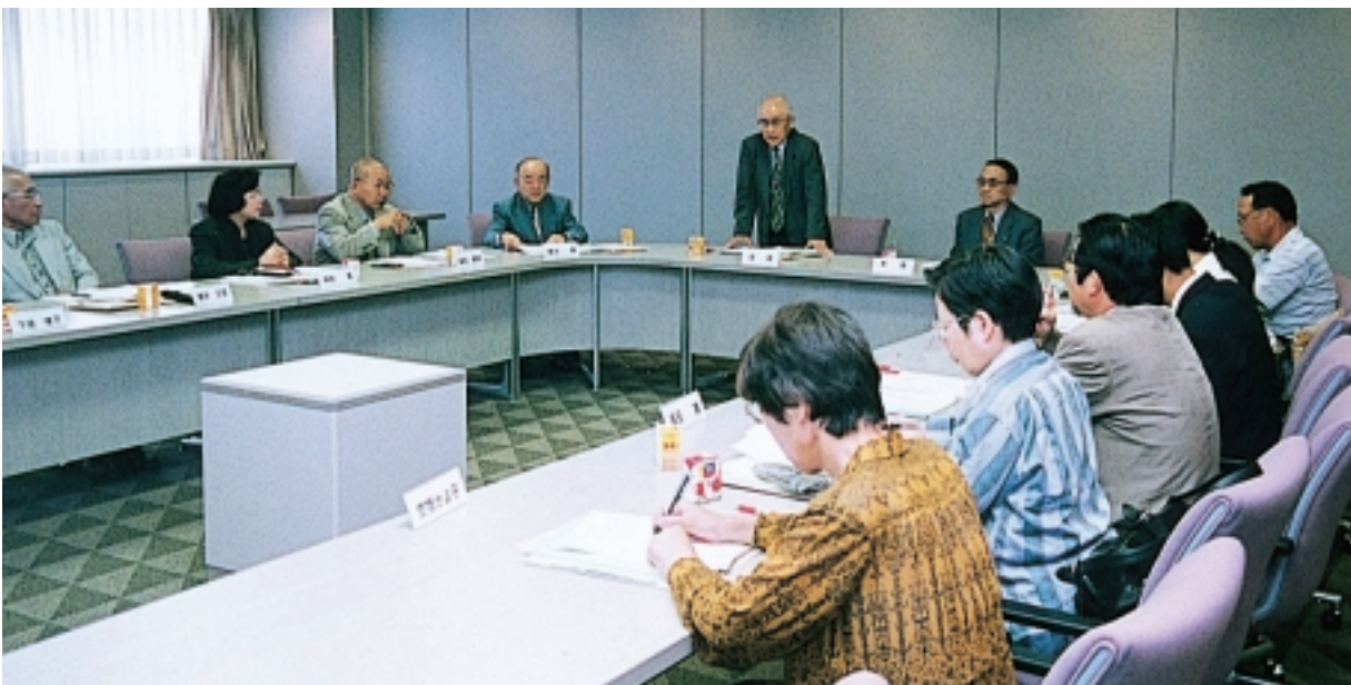
長期総合計画審議会

このような背景のもと、住民意識調査や各種団体との行政懇談会、さらに、まちづくり委員会の開催を通して、住民からの数多くの意見、提言などを踏まえて策定した第3次総合計画は、こうした社会環境の変化に的確に対応していくとともに、21世紀初頭におけるまちづくりの目標や、基本的な考え方を示し、総合的、長期的指針を与えるものである。