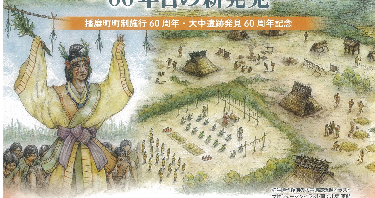
弥生時代後期の大中遺跡想像イラスト 女性シャーマンイラスト画：小東 憲朗