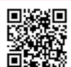
マイナポータルを使った国民年金の加入の手続・保険料免除申請

マイナポータル(電子申請)を使った国民年金の加入の手続・保険料免除申請などが開始されました。スマートフォンやPCから、申請ができ、申請に行く手間が省けます。ぜひ、ご利用ください。