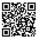
生け垣づくり補助金交付制度