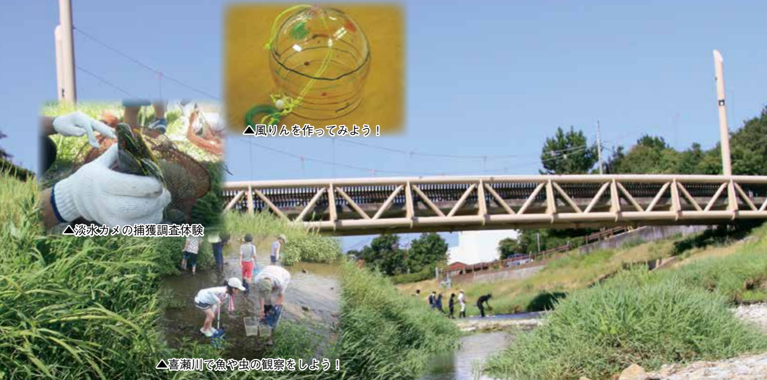
△風鈴を作ってみよう！