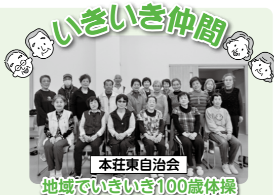
本荘東自治会 地域でいきいき100歳体操

「われらいきいき仲間」いきいき100歳体操で元気アップ!に取り組みステキな皆さんをご紹介します。 今回ご紹介するのは、本荘東自治会の皆さんです。平成27年2月から毎週水曜日午前10時から11時、真新しい本荘東公民館に集まって元気アップ中です。 始めるきっかけは、100歳体操教室を終了した方が地域で開催できないかと、シニアクラブやサロンなどで活躍されている方に相談したところ、「いきいき100歳体操」とは、重りを使った筋力運動です。イスに座って30分ゆっくり手足を動かします。新しく教室を始めた方が3人集まれば開催を応援します。保険年金グループにお問い合わせてください。 保険年金グループ☎079(435)2582