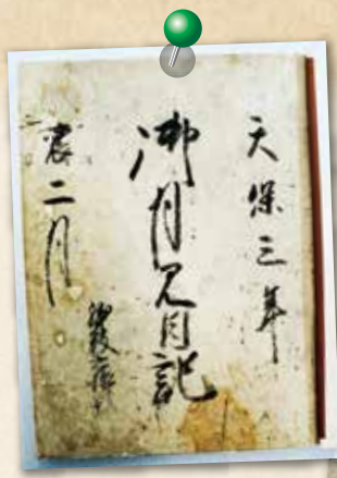
▲御月見日記(中巻表紙)

当時、天体観測のマニュアルとして使用された中国の歴史書「晋書」 しんじょ では、オーロラは兵乱、彗星は大水害が起こる予兆とされていました。特に、一番恐れられていたのは日食で、「君主に過失があれば、日は必ずそれを知らせる。日の色が消えうせるとき、国は衰退する」とされ、天が発する人間への警告とされていました。