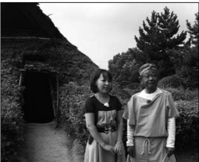
▲大中遺跡まつりを特集します。 (10月18日～31日放送)

募集中! あなたのイメージは、どんな漢字でしょうか? 下記までお寄せください。 福祉グループ ☎079(435)0831 〒675-0182 播磨町東本荘1丁目5番30号