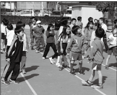
▲写っている方に画像データを差しあげます。企画グループへお電話を。