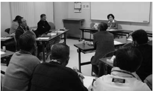
1月24日(土) 午後7時～8時30分 南部コミセン 参加者10人