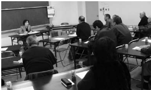
1月18日(日) 午前10時～11時45分 野添コミセン 参加者17人