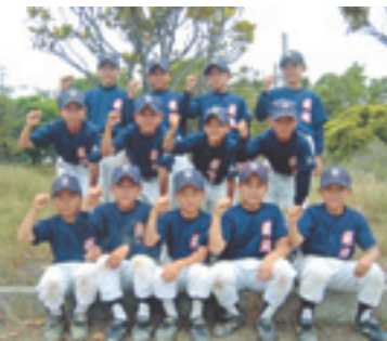
▲野球で国境を渡ります

この大会は、兵庫県内の各ブロック 大会を勝ち抜いた16チームが出場して 4月に行われた「第25回全日本学童軟 式野球大会」で、ベスト4に上り詰め たうちの2チームが出場する国際交流 試合です。