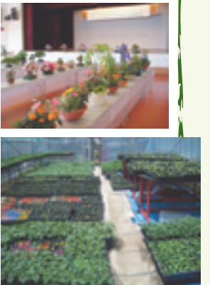
▲温室で苗を育てています

きた花苗が約1万個できあがりまし た。学校や公共施設、緑化グループな どに提供し、たくさんの方に喜ばれ ています。