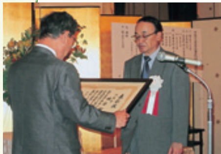
▲今後もよいまちづくりを進めます

全国町村会において、本町の進める まちづくりが、まち全体の活性化に寄 与したことが認められ優良町村として 表彰を受けました。