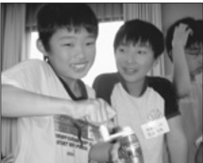
▲写っている方に写真または画像データを差しあげます。企画調整課まで。