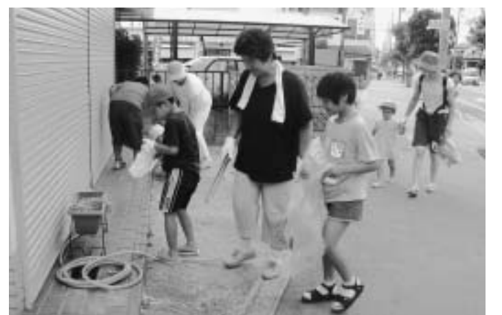
▲みんなでまちを気持ちよく