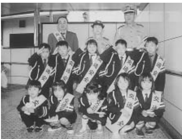
▲昨年の子ども警察官

子ども警察官街頭啓発 山陽電鉄播磨町駅前で、警察官の制服を着用した小学児童が、交通安全を呼びかけます。