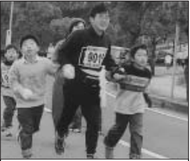
▲写っている方に写真または画像データを差しあげます。企画調整課まで。