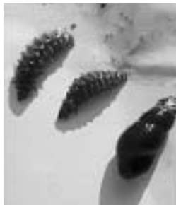
▲蛭の幼虫とエサのカワニナ

また、今は水質悪化のために見られなくなりましたが、喜瀬川には1960年ころまで、たくさんの蛭が見られました。今、再び蛭の飛ぶ交う景色を取り戻そうと、塵芥処理センターでゲンジボタルの飼育を行っています。飼育場の見学と鑑賞用熱帯魚の水槽でもできる飼育方法を紹介します。