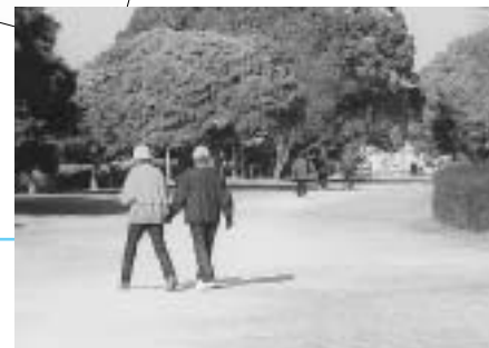
▲ウォーキングをする人が多勢います