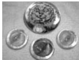
▲ペーパーウエイト

加古郡リサイクルプラザにある、県下でもユニークな吹きガラス体験ができるガラス工房にて、親子吹きガラス体験教室を開催します。お母さん、お父さんにはガラスコップ・お皿・箸置きから好きなものを、お子さんにはペーパーウエイトを作ってもらいます。ワクワク、ドキドキで楽しみながら親子ペアで吹きガラス体験をしてみませんか。