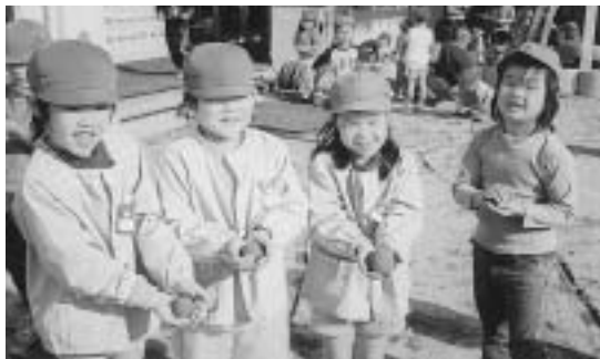
▲見て見て！こんな泥だんご