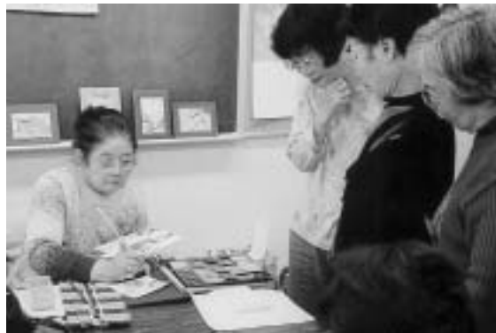
▲毎回ならんで指導を受けます