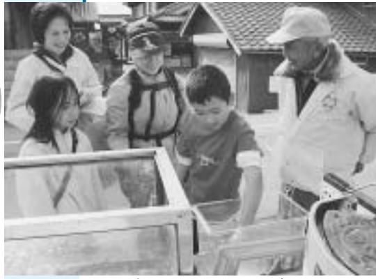
▲ため池を通じてふれあい交流

11月22日(土)、播磨町子ども会育成連絡協議会主催の「ふれあいため池ウォーク」が開催されました。 コースは町内11カ所のため池をまわる約10キロメートル。約120人の小学生とその家族の参加者は、水利組合の方からフナとコイの見分け方を教わったり、試験薬を使って水の酸度を調査したり、望遠鏡でヒドリガモなど鳥の名前を覚えたりして、ため池の魅力を再発見しました。