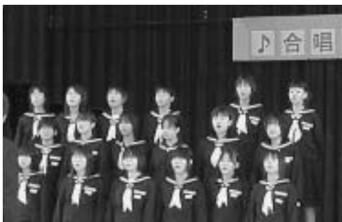
▲2年合唱コンクールより

11月は、校内行事やPTA活動で忙しい一カ月でした。7日(金)、「文化祭」では、各学年の歌声がびびくとも文化部の発表と展示、生徒会役員による劇も好評でした。