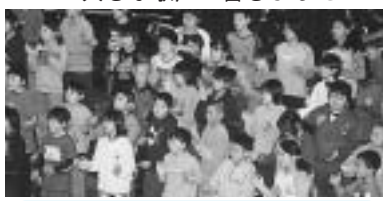
▼大きな歌声が響きました

「ニッサンのエコー」のCM曲の作曲者が、9月に来町し、「音楽と平和について」の講演会を行いました。「エコー」のCMを竹ハチで筆を添えて演奏する意図を伝えたら、作曲者は「それはすごい!」実はずっと「へりな楽器で演奏しているの、ぜひ良い音楽会にしてください」と励ましてくれました。