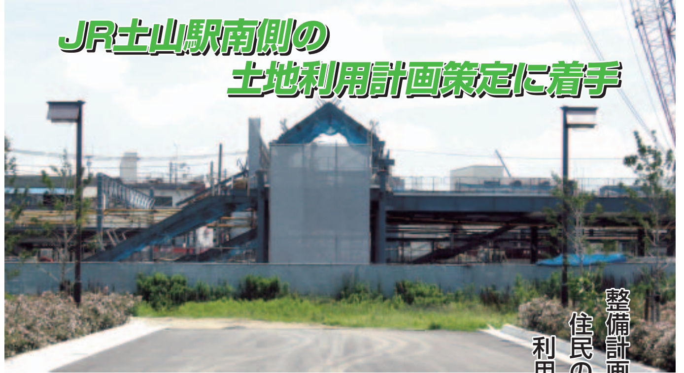
▲工事が進むJR土山駅