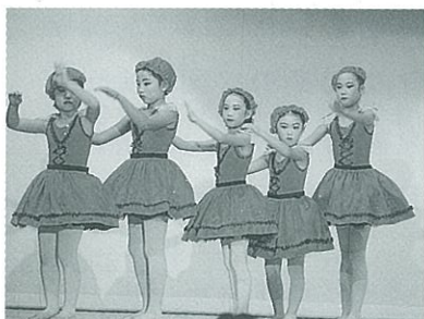
▲子どもたちのかわいらしい演技