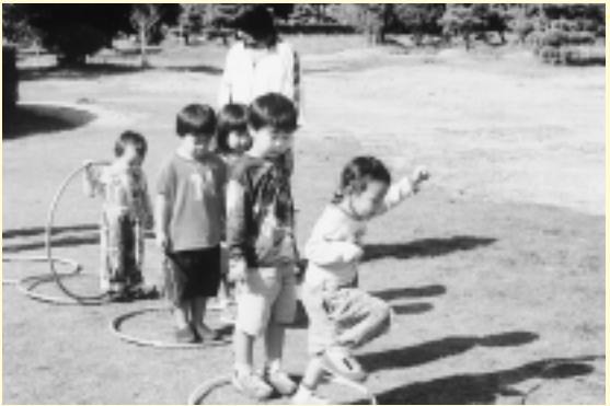
カンガルー学級のお友だち

子ども読書サポーターボランティア募集 子どもにとって読書は想像力や考える力を身に付け、豊かな感性や情操を育む上で大切な営みです。そのため小学校の図書室の開館時間の増加や読書指導の充実などにより、子どもたちが図書室をより利用しやすくなるよう、図書室の仕事をお手伝いしていただける方を募集しています。 特に資格の有無を問いませんが、図書館司書の資格を持っておられればより歓迎します。また、お手伝いいただける日数や時間数の多少も問いません。できるだけ多くの方にかかわっていただき、よりいっそう地域に根ざした学校の実現を図って行きたいと考えておりますので、どしどし応募ください。 お手伝いいただける方は、住所、氏名、希望する小学校名等を所定の申し込み用紙にご記入の上、町教育委員会総務学校教育課までご提出ください。 詳細や申し込み用紙等は、総務学校教育課で配布しています。お電話をいただければ郵送もします。 応募期限 4月30日(水) 問い合わせ 総務学校教育課 ☎0794(35)0533