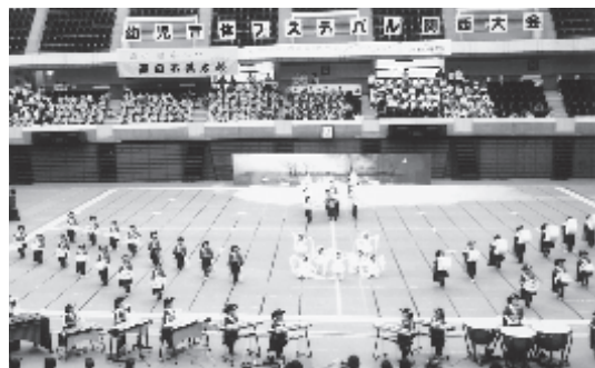
カッコよく決まりました

好天に恵まれた11月16日(土)、幼児音楽フェスティバル関西大会がグリーンアリーナ神戸にて開催され、元気一杯の5歳児が出演しました。今回は、「運命」「白鳥の湖」「新世界」と、今までに演奏したことの無いクラシックに挑戦です。初めて手にする楽器やカラーガードは練習を重ねる度に愛着が湧き、心を一つに奏でるハーモニーの楽しさも知ることができました。本番では、憧れの衣装を身にまとい、立派な鼓笛隊へと変身した子どもたちの演奏が会場中に流れだしました。涙と拍手喝采を浴び、精一杯の力を出し切った皆の顔はたくましく凛々とし、達成感に満ち溢れ、まぶしく光り輝いていました。きつと、鼓笛を通し、やれ、やれと実感し、大きな自信になったことでしょう。