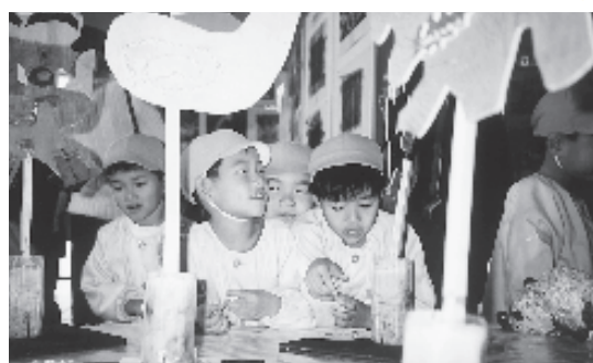
ぼくの作品あるかなあ

11月26日(火) 今日是一年長児と年中児が一緒に子ども美術展を見に行きました。行く途中では「危ないからこっちは通りな」と道の内外をかわつたり、「車来たからストップや」としつかりと見て教えたものと見ていました。