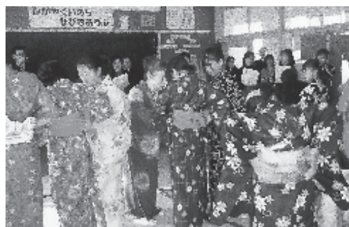
上手に帯も結べました

播磨小学校では11月22日(金)に、家庭教育研究会の一環として、第2回「播磨っ子デイ」を行いました。学習の名称は「Let's enjoy Harisho 2.」ですが、子どもたちは、保護者・地域住民・教育機関職員などの皆様の指導により、着物の着付けや、Tシャツ・勾玉・ビーズ・とうふうづくりなどを行いました。その中で、でき上がった料理に舌鼓を打ったり、手作りの竹とんぼはやたこで遊んだり、楽しく大喜びの日でした。こうした活動を通し、子どもたちは身近な生活の中で、よりよい暮らしをつくっていくのは、何より自分たちの創意・工夫であることとを知ってくれたものと思います。