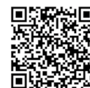
議会ホームページ