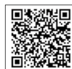
委員会報告書はこちら

答 計画素案の概要版を音声付き動画として町ホームページで公開し、説明会に参加できない住民にも確認できる環境を整えた。こうした工夫により、住民周知に努めた。