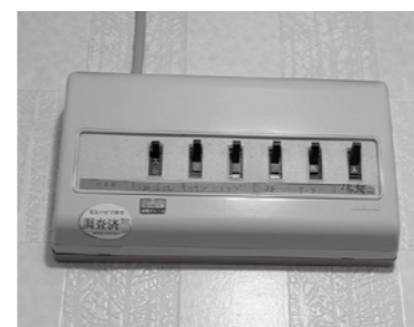
家庭のブレイカーに感震装置を