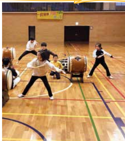
▲元気に和太鼓練習