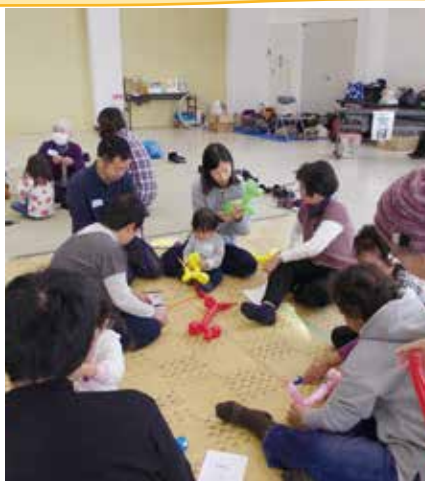
▲楽しく三世代交流