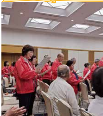
▲ゆうあい園交流会