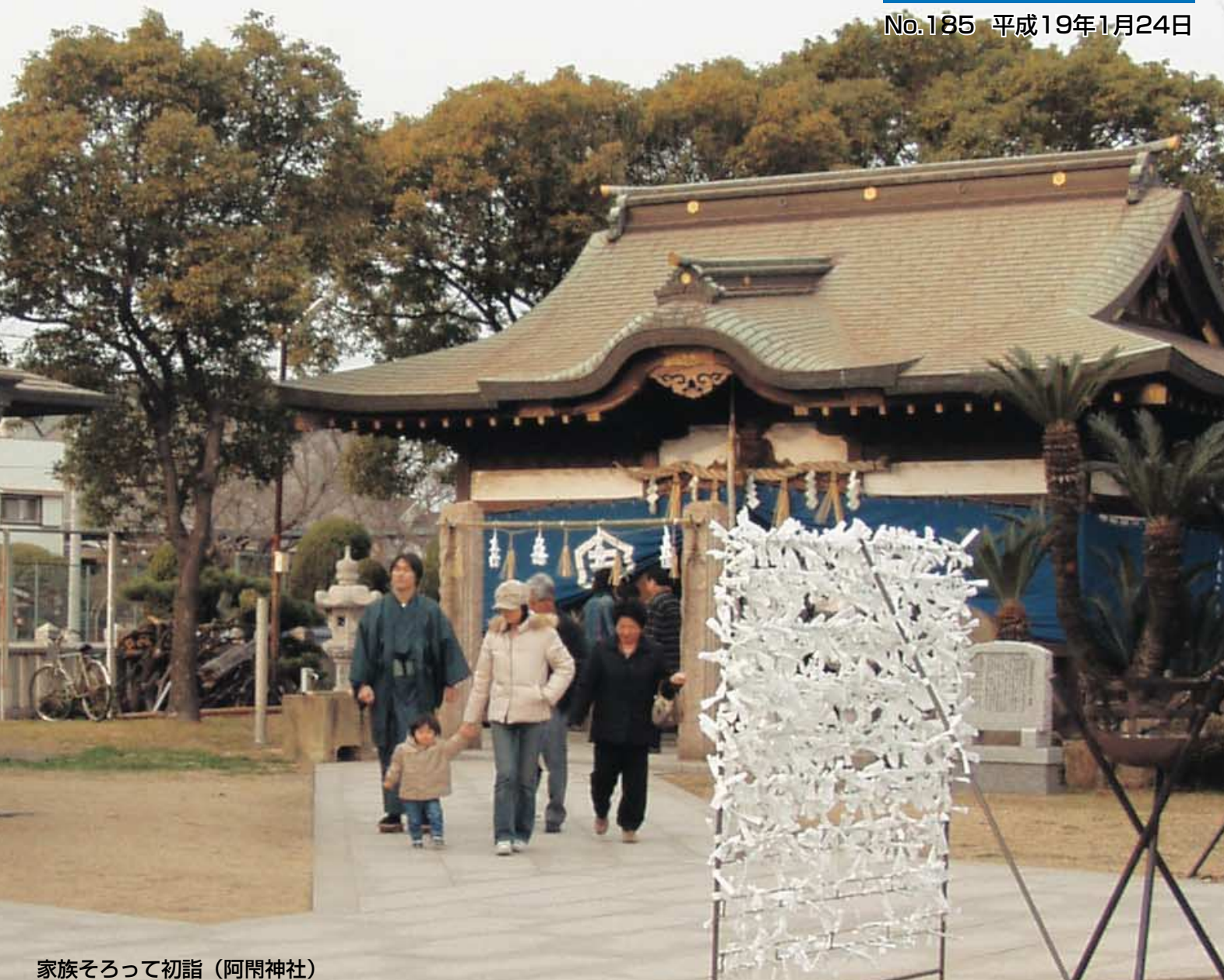
家族そろって初詣（阿閉神社）