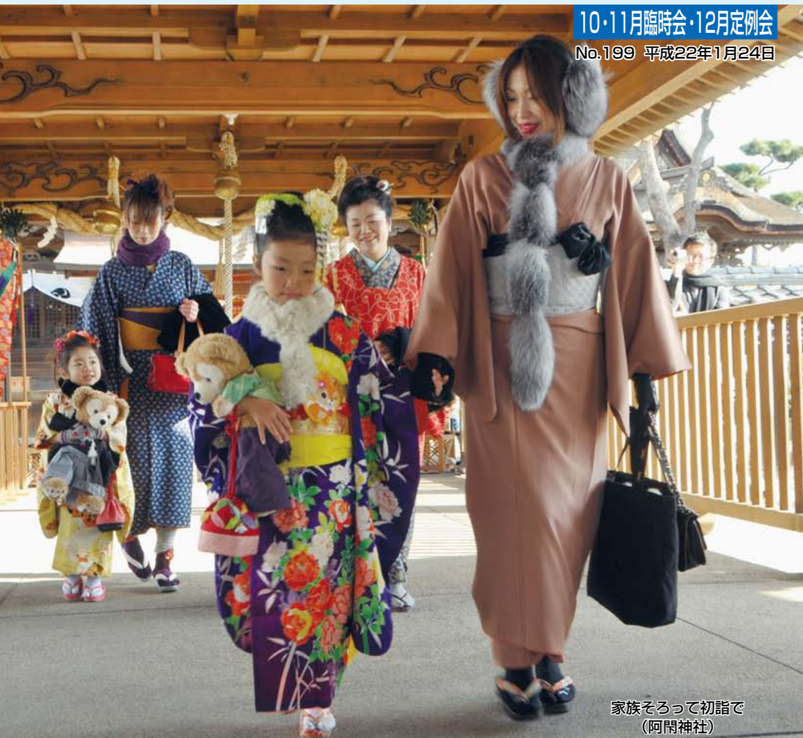
家族そろって初詣で (阿閑神社)