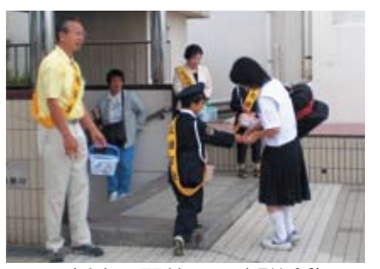
▲播磨町駅前での啓発活動